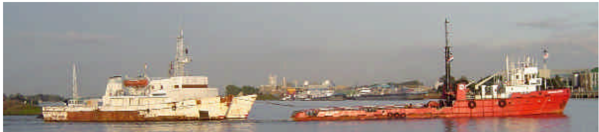
The THOMAS DE GAUWDIEF at departure Saturday

After a long and serious dispute, for which reasons "Landfall" Transport & Towage, had arrested the old Russian survey catamaran " Iskatel 2 " in November 2000, they recently reached a settlement agreement with the Maltese/Italian buyers through the High Court of Justice in London. Consequently, this catamaran, which had "enriched" the skyline of Sliedrecht for more than two years and nine months, was released again and today 16th August 2003 the " Iskatel 2 " departed from Sliedrecht via Dordrecht to open sea by Landfall's own tug " Thomas de Gauwdief " with destination Ravenna in Italy. It is the Italian buyer's intention to refurbish the " Iskatel 2 " and to convert her into a diving support vessel for one of their projects in the Red Sea.