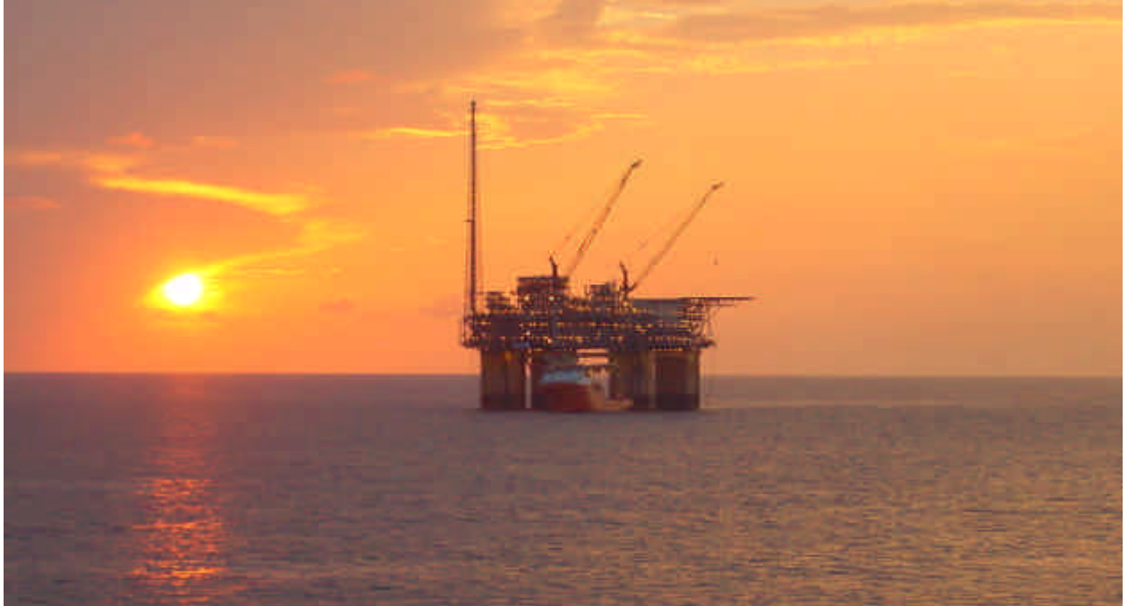
Sunset at the NA KIKAFDS location with the NORMAND IVAN operating as Survey vessel