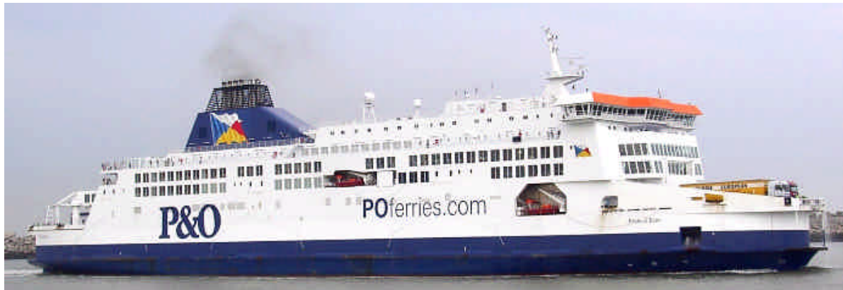
The PRIDE OF KENT seen here departing from Calais