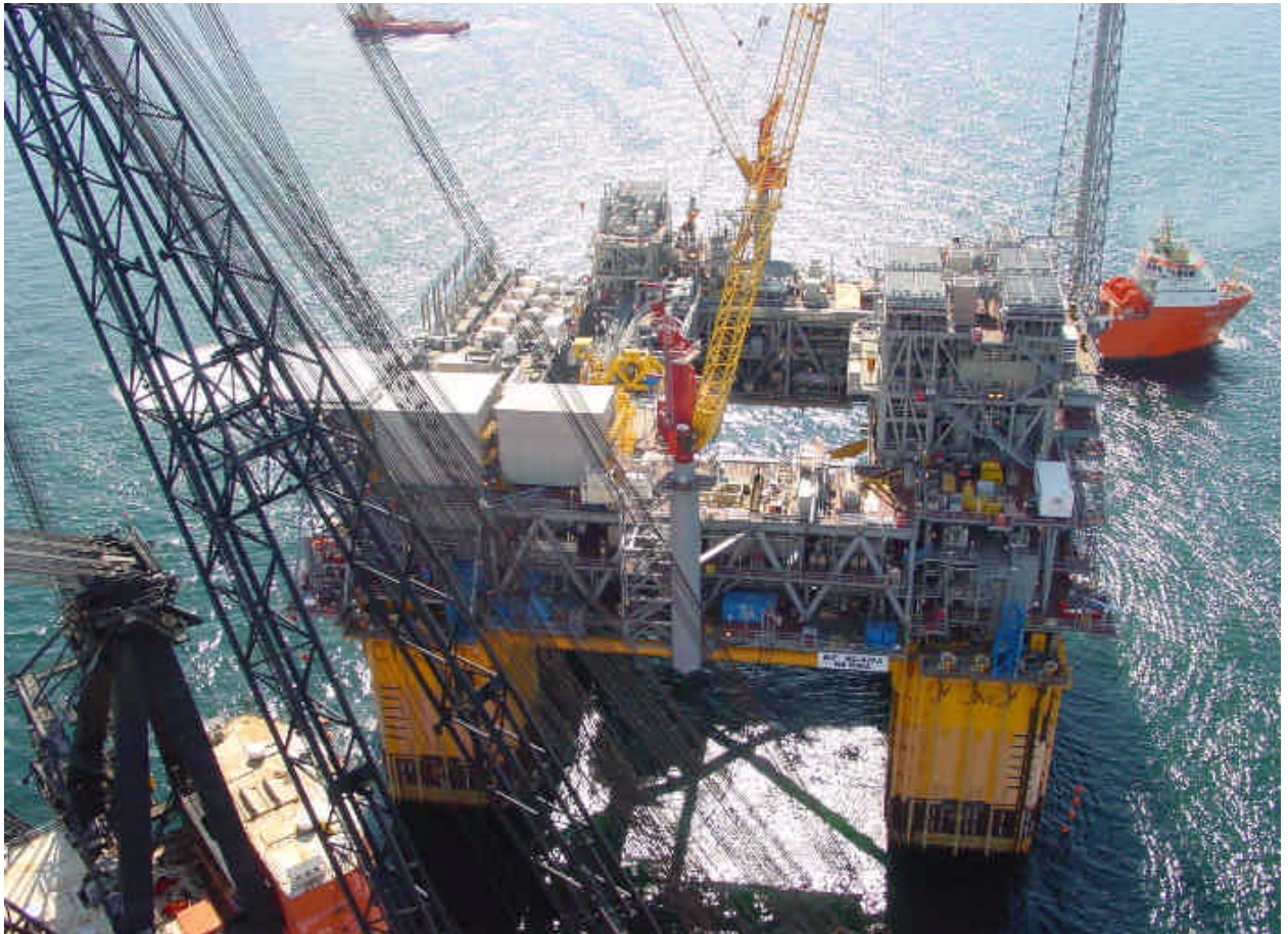
A birds-eye view of the NA KIKA platform from the J-lay tower onboard the Balder

Yet an other outstanding achievement from the Balder and its crew after the successful conversion from SSCV to DCV.