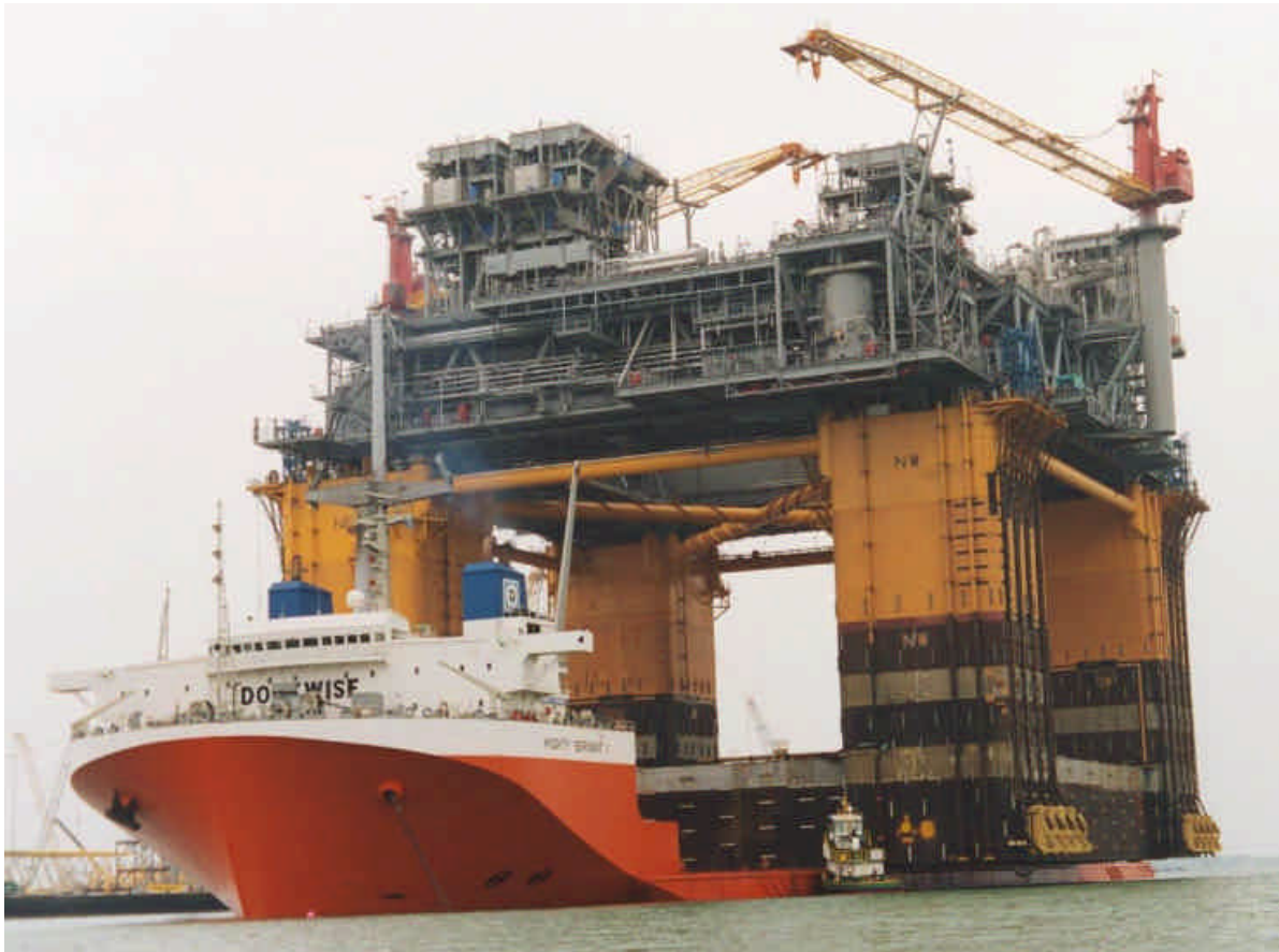
The MIGHTY SERVANT 1 with the NA KIKA platform